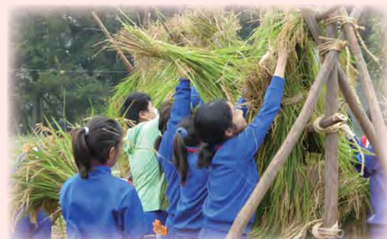
多面的機能支活動組織 石母田ふるさと保全会 多面的機能支交付金活動組織優良表彰宮城県知事賞受賞 【加美町立宮崎小学校 稲刈り体験】