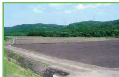
中山間地域総合整備事業 南鹿原地区

農業の生産条件等が不利な中山間地域において、農業生産基盤の整備と併せて、農村生活環境基盤等の整備を総合的に実施することによって、中山間地域における農業農村の活性化を図るとともに国土・環境の保全等を図ります。