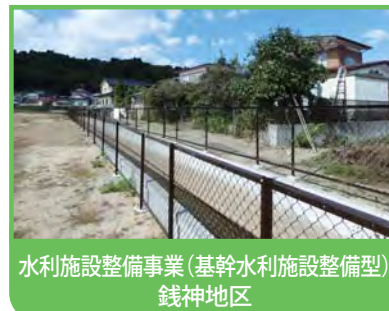
水利施設整備事業(基幹水利施設整備型) 銭神地区

ダム・頭首工・用排水機場・幹線用排水路等、基幹的な農業用排水施設の整備を行い、用水不足の解消や水害防止をはじめとした水利用の安定と合理化により、農業生産性の安定を図るものです。