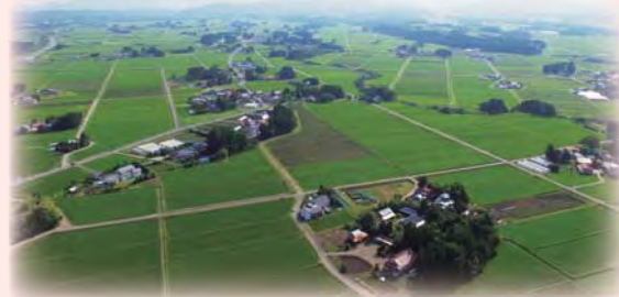
「大崎耕土」の巧みな水管理による水田農業システム 日本農業遺産認定・世界農業遺産国内審査通過