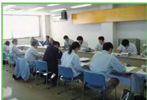
農業農村支援活性化推進会議 下野目東部地区

農業農村整備事業に係る農家等の多様な意見・要望を集約し、各行政セクションとの緊密な連携により各種施策を展開し、総合的な事業効果の発現を支援します。