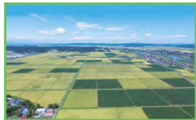
農地整備事業 鹿島台東部地区 (平成27年度完了)

水田の区画整理工事を中心に用排水路・道路・暗渠排水・客土等総合的な整備を行い、大型機械の導入による労働生産性の向上を図るとともに農地の汎用化を推進します。