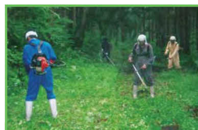
中山間地域等直接支払制度 芋沢集落

中山間地域等における多面的機能の維持・増進を図るため、自立的かつ継続的な農業生産活動等の体制整備に向けた前向きな取り組みを支援します。