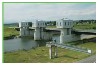
基幹水利施設管理事業 桑折江頭首工

国営土地改良事業で造成された基幹的な農業水利施設について適正な維持管理を行います。