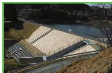
県営ため池等整備事業 貝抜沢地区

自然的社会的状況の変化で脆弱化している農業用施設で、豪雨・地震等で被災した場合、周囲の農地・施設・人家等に被害を与えるおそれがあるものについて、被害を未然に防止するため、施設の整備・補強を行います。