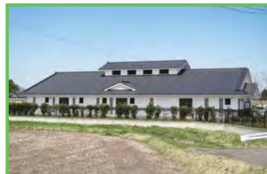
農業集落排水事業 西古川地区

都市に比べて立ち遅れている農村の生活環境の整備と、これと密接な関連のある農業生産基盤の整備を一体的・総合的に行うもので、農業集落排水施設の整備をはじめ、集落道路・集落排水路・農村公園・営農飲雑用水施設・農道・農業排水路等を整備します。