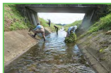
多面的機能支払交付金 土砂払い作業

農業の多面的機能の維持・発揮のため、地域ぐるみで効果の高い共同活動を一体的かつ総合的に支援します。