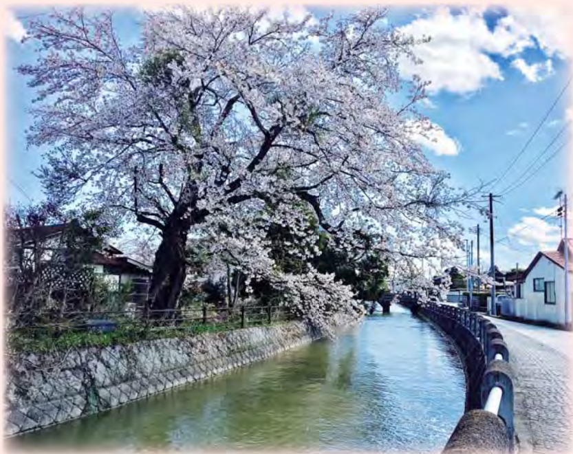
内川 世界かんがい施設遺産 登録