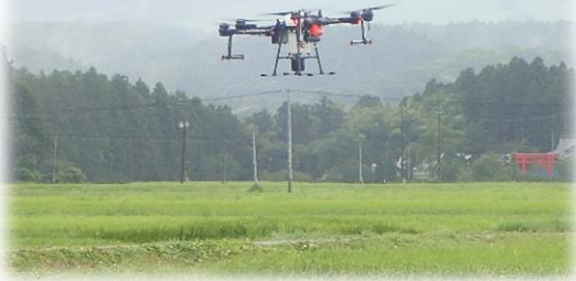
▲農薬散布用ドローン

今までは多くの労力がかかっていた防除作業ですが、散布用ドローンの導入により作業へ費やす人の労力を軽減し、管理・観察作業へ時間をかけることが可能となり、より効率的な高品質種子の生産を実現することができます。