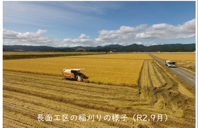
長面工区の稲刈りの様子 (R2.9月)

本地区は東日本大震災により、甚大な被害を受けましたが、全国からのご支援及び地域住民と各関係機関が一体となった復旧・復興の取組により、今年中に全ての農地の復旧工事が完了する見込みです。