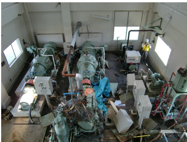
長面排水機場被災状況 (H23.6月)

大川地区北東部に位置する長面排水機場において、令和2年6月末までにポンプ設備の復旧工事が完了し、Φ700mmのポンプ2台が稼働可能となりました。