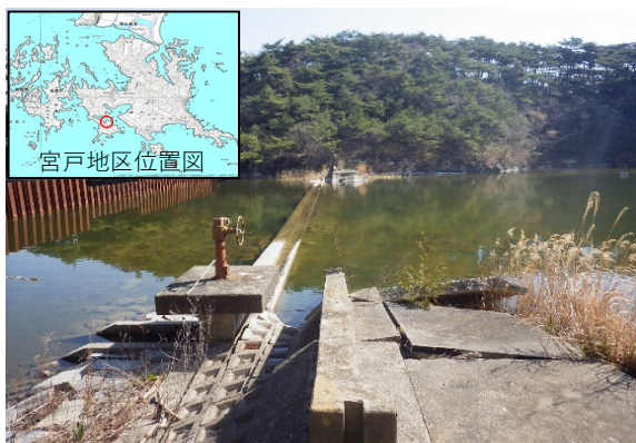
小目軽海岸 着手前 (H25.11月)