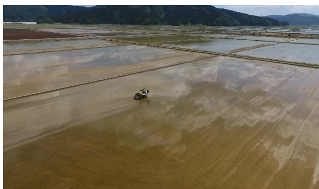
大川地区の田植状況(R2.5月)