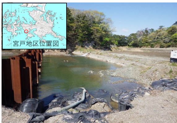
二郷田海岸 着手前 (H25.11月)

令和2年8月、東松島市宮戸地区の二郷田海岸及び小目軽海岸の復旧工事が完了し、これにより、復旧が必要な農地海岸89か所全ての復旧工事が完了しました。