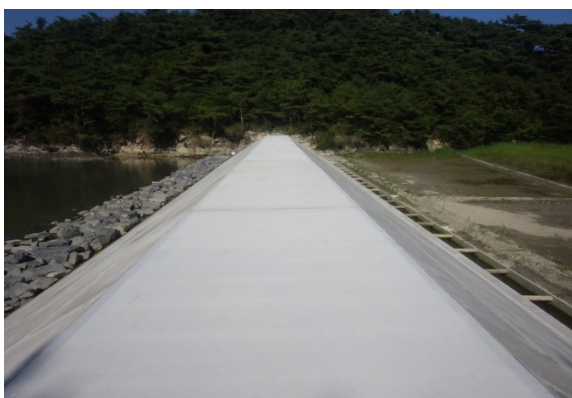
小目軽海岸 完成 (R2.8月)