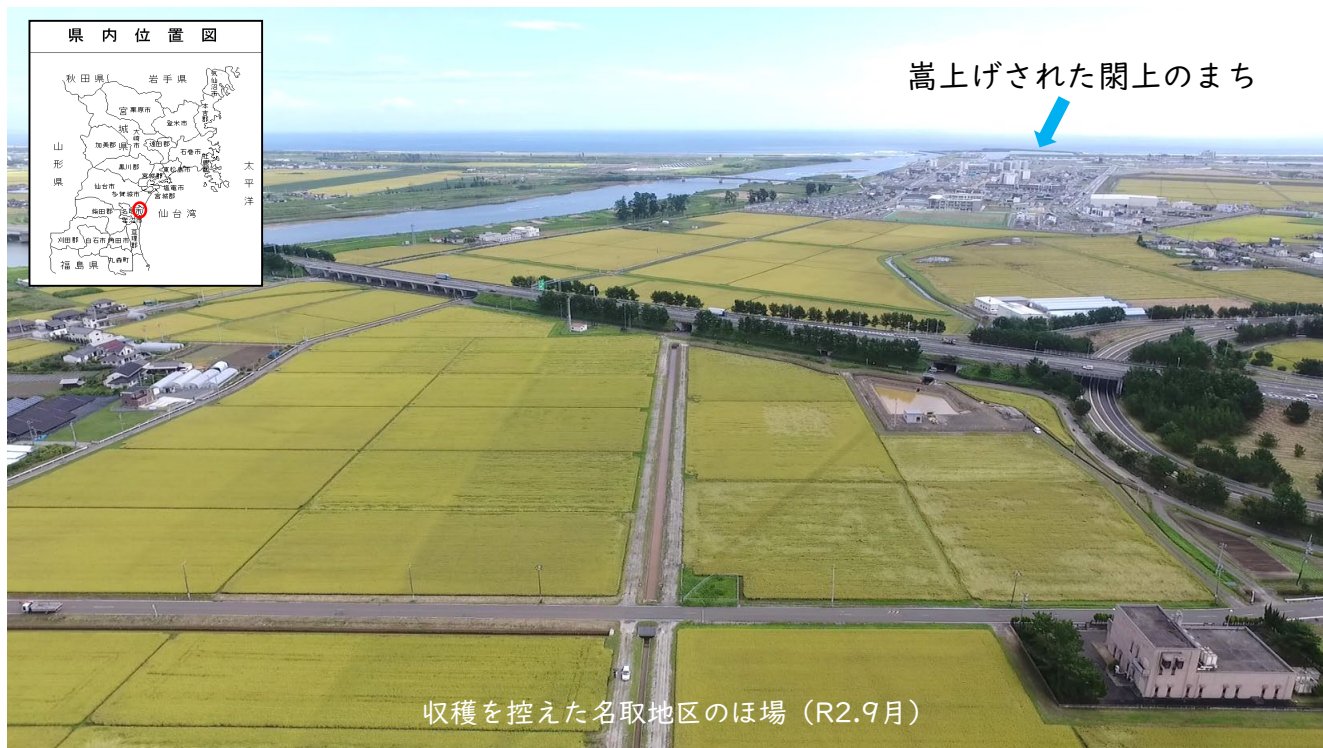
収穫を控えた名取地区のほ場（R2.9月）