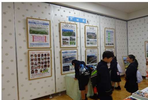
一般見学の様子（昨年度）

令和2年11月9日から13日まで、東京都千代田区の農林水産省「消費者の部屋」にて岩手県、福島県との共催により「農業農村復旧・復興パネル展」を開催します。農地の被災直後の様子と、復興後の現在の様子に対比し、復旧・復興事業の10年間の成果をパネル展示にてお伝えします。どうぞお立ち寄りください。