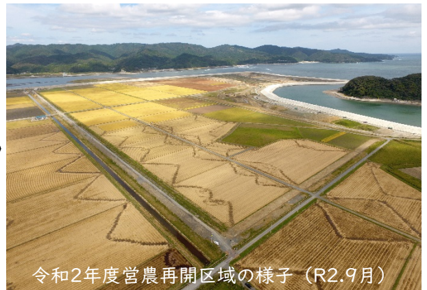
令和2年度営農再開区域の様子 (R2.9月)