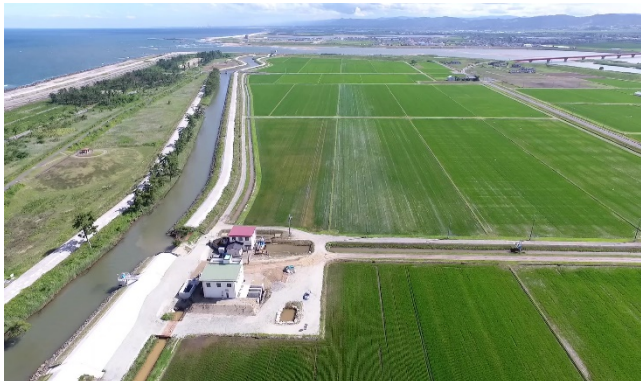
岩沼地区の作付状況(R2.6月)