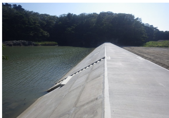
二郷田海岸 完成 (R2.8月)