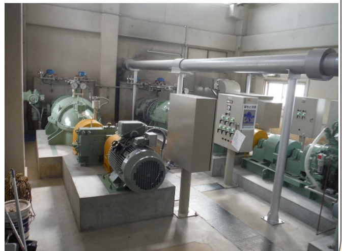
ポンプ設備完成写真 (R2.6月)