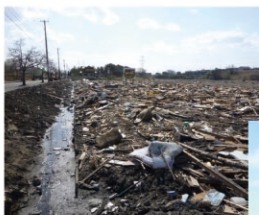
農地の浸水(七ヶ浜町)