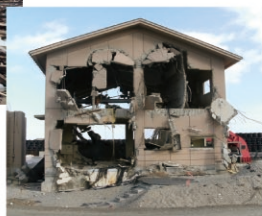
津波による排水機場の被災(山元町)