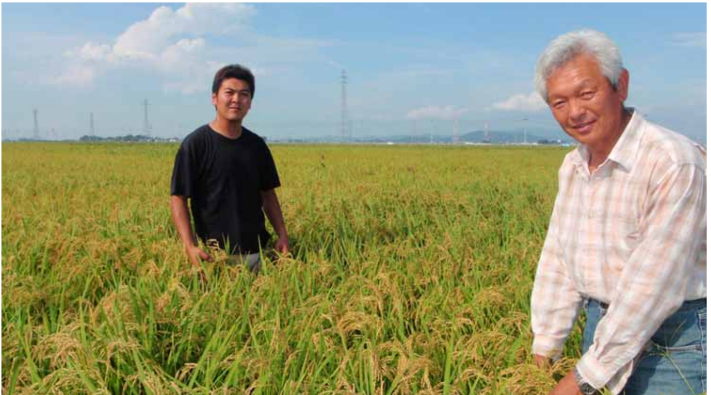
水稻生育確認状況(平成23年9月)