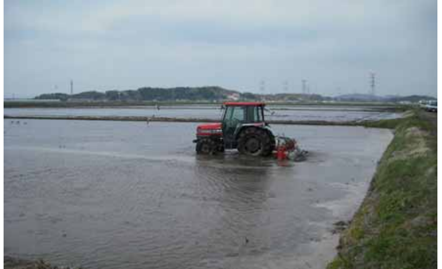
除塩作業状況(平成23年4月)