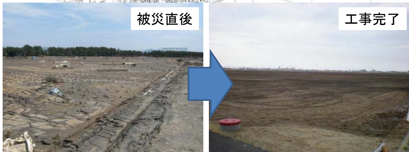
大曲地区の津波による被災と農地復旧状況