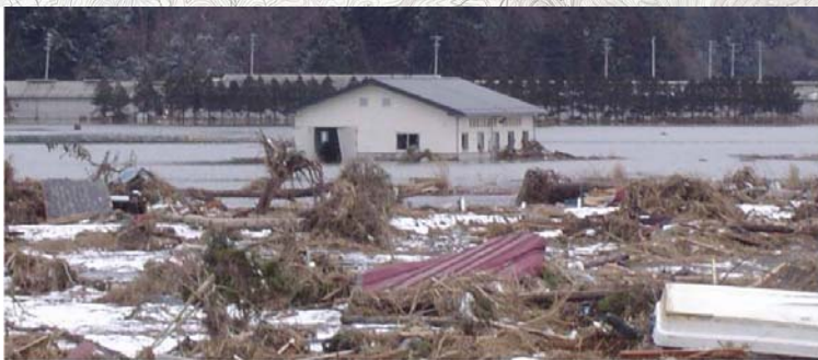
針岡第3揚水機場周辺被災状況(平成23年3月)