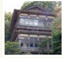
伊達藩主の宿所「青根御殿」。現在の建物は昭和初期に再建されたものです。

弱アルカリ性単純温泉で、肌が弱い方や赤ちゃんにも優しいお湯です。ゆっくり浸かるなら、水分補給を忘れずに。