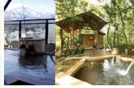
温泉に入りながら蔵王連峰を眺めたり、木々に囲まれた露天風呂で森林浴も一緒に楽しめます。

ウナギとカニの伝説 昔、蔵王町にある三階滝に大きいカニがすんでいました。成長するにつれ、自分の滝だけでは狭くなったので、隣の不動滝を自分のものにできないかと考えました。ところが、不動滝には大きいウナギがすんでいました。カニはウナギに腕くらべをやろうと申し込み、戦いの末、カニはウナギの体を3つにちよん切ってしまいました。ちよん切られたウナギの尾は遠刈田温泉へ、胴は峩々温泉へ、頭は青根温泉に飛んでいったため、それぞれの温泉は、足腰の病、胃腸の病、頭の病に効くようになったと伝わっています。