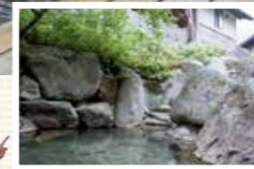
断崖を眼前にして入るダイナミックな露天風呂。迫力満点です。

秘湯ムード漂う一軒宿のいで湯 蔵王の山々に囲まれた静かな山間に湧く秘湯の一軒宿。自家源泉の湯は、古くから胃腸によいことで有名です。150年にわたり受け継がれる湯治文化と豊かな自然が、訪れる人の心身を癒やしてくれます。