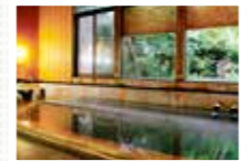
日帰り入浴も可能な自噴の源泉かけ流しの温泉。

含石膏芒硝泉の湯は、昔から薬効があるといわれてきました。ぬるめの湯なので、おしゃべりしながら長湯するにはもってこい。