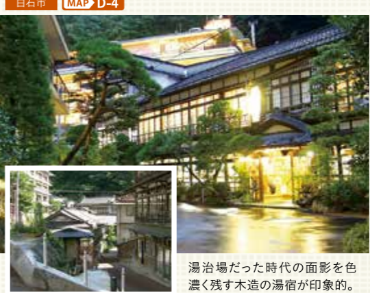
湯治場だった時代の面影を色濃く残す木造の湯宿が印象的。

寄り道スポット 粹 sui 鎌先の温泉街中央の素敵なカフェ。地元食材を生かした軽食や、宮城県内各地からセレクトした特色ある商品の買物を楽しむことができます。