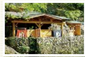
湯治場として古くから愛されていた場所です。泉質は肌に優しい弱アルカリ性の単純温泉等で、ゆっくり浸かれます。

渓谷の自然美を楽しめる湯の里 800年以上の歴史を重ねる温泉郷。白石川上流の渓谷に沿って2軒の宿泊施設と共同浴場「かつらの湯」があり、新緑や紅葉といった美しい渓谷美を満喫できます。地元では古くから「目に小原」と親しまれ、多くの人が訪れています。