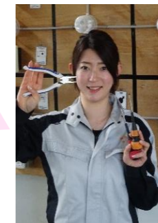
電気科 修了生 Nさん (一般応募)

入学したばかりの頃は工具の名前も使い方も知らなかった私が、先生方の指導のおかげで電気工事の知識と技術を身につけることができました。特に、モデルハウスの配線実習は電気科全員で工事を行い、無事に完了して電気がついたときは嬉しく、達成感がありました。大崎校で経験を積めば電気工事士も夢じゃない！