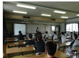
ビジネスマナーの講話