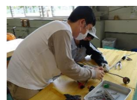
オープンキャンパス (年3回実施)