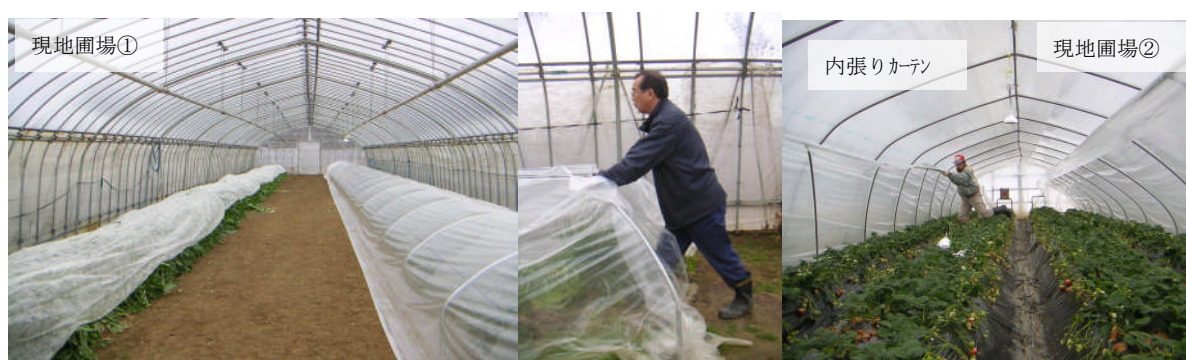
図2 プンタレッラ (左・中) とイチゴ (右) 栽培圃場と開閉作業の様子