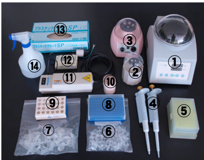
図 3 検定に必要な器具類（例）