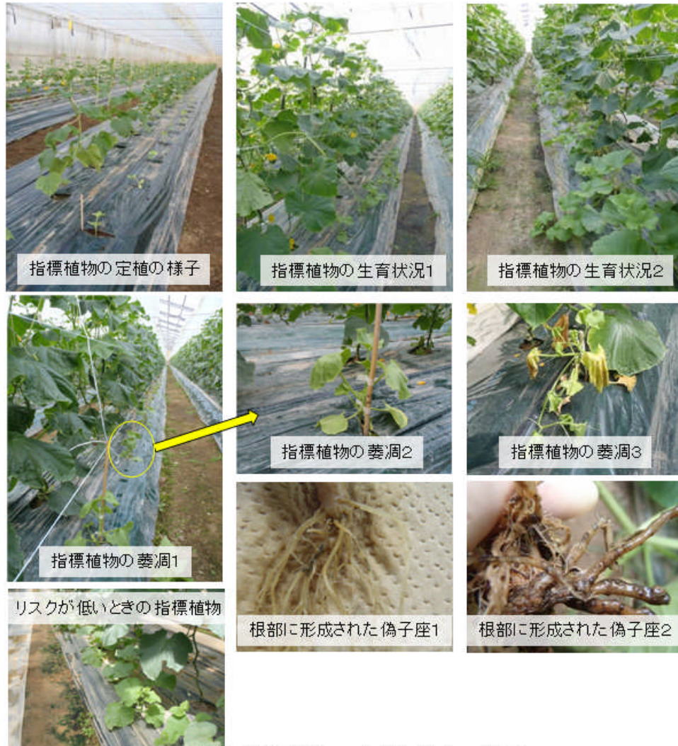
図1 指標植物の定植と被害の様子

～指標植物の導入方法～ 【指標植物】1葉期まで育苗したメロン苗(品種:アールスナイト夏系2号) 【定植】キュウリ定植後早い段階に、畝の肩に10株3か所(対角線上)または5株5か所(4隅と中央)に定植する。なお、定植直後に害虫の寄生による被害を避けるため粒剤を施用するとよい。 【管理】メロンが大きくなった場合は、キュウリ栽培に影響しないよう適宜整枝を行い(4～5葉程度)、病虫害管理はキュウリと同時防除で行う。 ※汚染圃場であった場合、指標植物定植後早ければ約20日後に指標植物に症状が認められる。