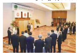
レセプション(令和元年 沖縄県)

その他、皇族方御臨席のもと 緑化功労者等を招いた懇談会(歓迎レセプション)を開催