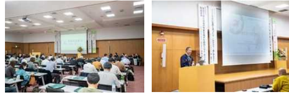
育林交流集会(令和4年 大分県)