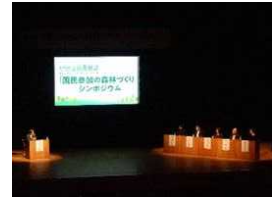
森林づくりシンポジウム (令和4年 茨城県)

全国育樹祭の開催気運を高めるための1年前プレイベント 基調講演、パネルディスカッション等