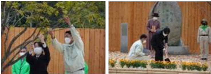
お手入れ行事(令和4年 大分県)

全国植樹祭において天皇皇后両陛下がお手植えされた樹木への、皇族殿下によるお手入れ