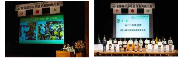
緑の少年団活動発表大会(令和4年 大分県)