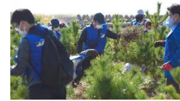
海岸防災林保育活動