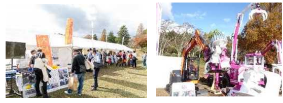
機械展示実演会(令和4年 大分県)