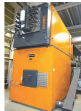
木質バイオマスボイラー

デ・リーフデ北上では、オランダの高度な栽培技術を取り入れ、トマトとパプリカ栽培用の温室に、LPガスボイラーの他、木質バイオマスボイラー、地中熱ヒートポンプを利用して熱供給を行うことで、化石燃料の削減を行っています。また、この設備から排出されるCO 2 をハウス内に取り組み、作物の光合成促進に利用しています。木質バイオマスボイラーに供給する原料は地元の森林組合から調達し、地域の資源循環にも貢献しています。また、津波被害のため塩害が生じ、地下水が使えない分、雨水を貯めておける貯水槽を備えており、ハウス栽培で利用する水の全てをまかなっています。