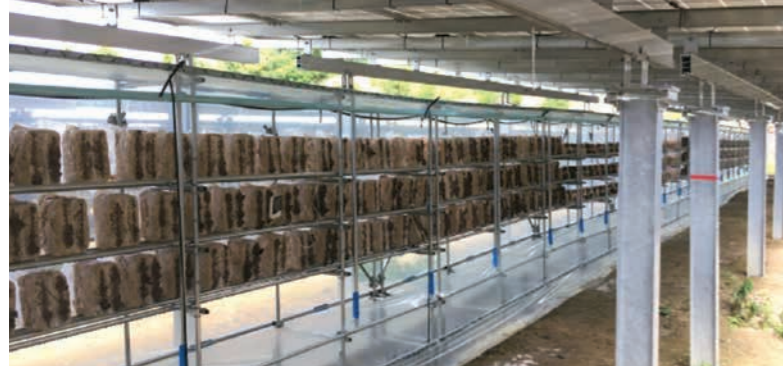
キクラゲ栽培の様子