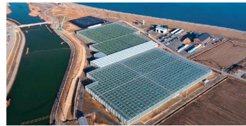
デ・リーフデ北上のハウス全景

デ・リーフデ北上では、オランダの高度な栽培技術を取り入れ、トマトとパプリカ栽培用の温室に、LPガスボイラーの他、木質バイオマスボイラー、地中熱ヒートポンプを利用して熱供給を行うことで、化石燃料の削減を行っています。また、この設備から排出されるCO 2 をハウス内に取り組み、作物の光合成促進に利用しています。木質バイオマスボイラーに供給する原料は地元の森林組合から調達し、地域の資源循環にも貢献しています。また、津波被害のため塩害が生じ、地下水が使えない分、雨水を貯めておける貯水槽を備えており、ハウス栽培で利用する水の全てをまかなっています。