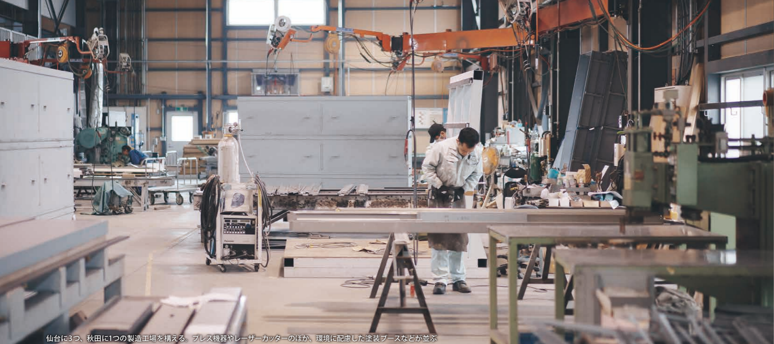
仙台に3つ、秋田に1つの製造工場を構える。プレス機器やレーザーカッターのほか、環境に配慮した塗装ブースなどが並ぶ