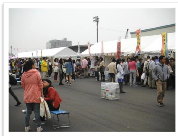
○ご当地グルメで賑わう仙台港