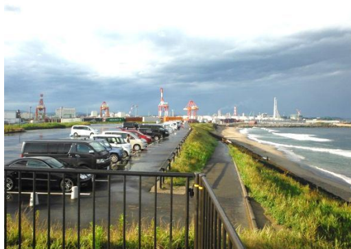
○海浜公園からの景色

是非、足を運んでみては、いかがでしょうか？（くれぐれも熱中症には、気をつけてくださいね。）