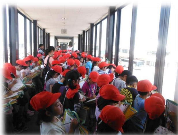
○一生懸命メモをとっています。