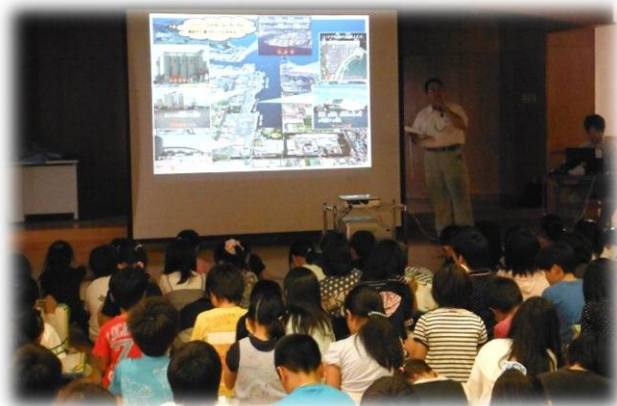
○七郷小学校の生徒さん、お勉強中！