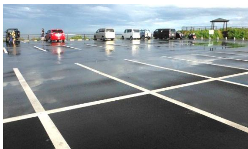
○駐車場もきれいに復旧しました！