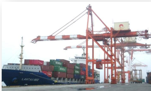
○高砂コンテナヤードに着岸する LANTAU BEE

震災以降、国際定期コンテナ航路が再開されております。今回は、昨年の3月31日に韓国航路として再開されておりました定期航路が中国まで延伸されました。運航船社は興亜海運（株）、高麗海運(株)であり、両社の共同運航で週一回仙台港へコンテナ船が入港します。中国延伸後の第1船は「LANTAU BEE」で6月18日に高砂1号岸壁に着岸し、コンテナを397個陸揚げし356個を積込みました。