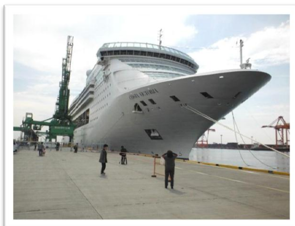
○大型客船コスタ・ビクトリア号着岸

船内では仙台港寄港の記念式典が行われ、宮城県土木部港湾課長による歓迎挨拶の他、コスタ・ビクトリア号クルーへの花束贈呈など今回の寄港への感謝の意を伝えました。