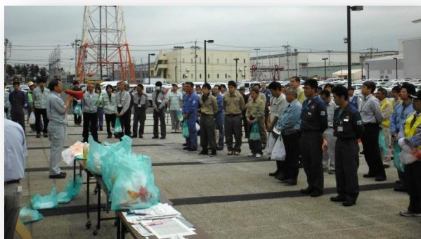
○たくさんの方々に参加して頂きました！

7/17（水）、仙台港区内におきまして一斉清掃を実施しました。当日は港湾利用者を始め、工事業者、周辺企業などから65社、約280名の方々に参加していただきました。