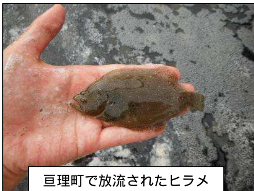
巨理町で放流されたヒラメ

苗4万尾が放流されたほか、16日には七ヶ浜町松が浜と東松島市宮戸月浜でも、それぞれ2万尾が放流される予定です。