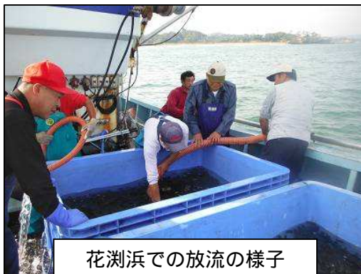
花洲浜での放流の様子