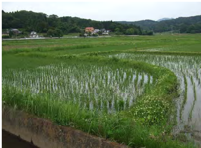
水田が狭小で不整形なため作業効率が悪く、大型機械による営農に支障を来している。