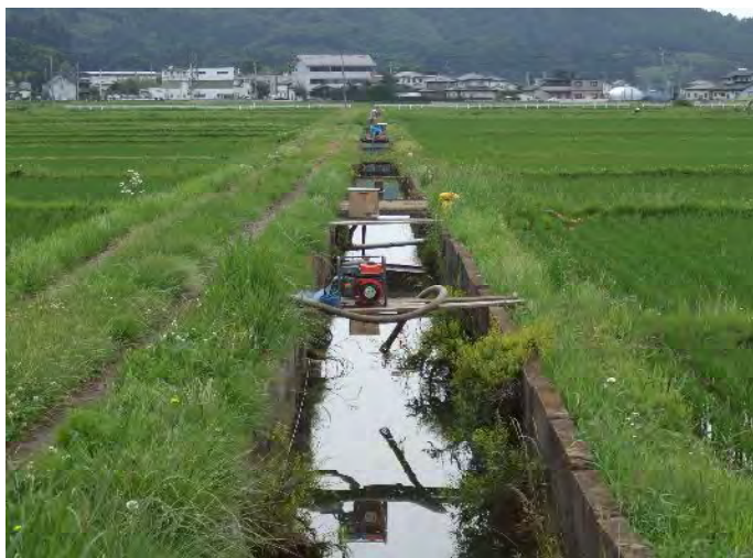
用排兼用水路のため、水管理に労務を費やしており、効率的な営農が図られていない。