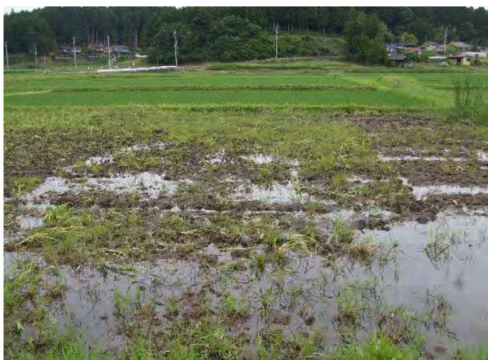
排水不良なほ場では、農地の汎用化が図れず、転作の実施に支障を来している。