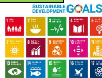
本ビジョン策定の経緯と計画期間・目標年度