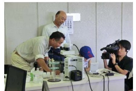
テレビ撮影で緊張？！