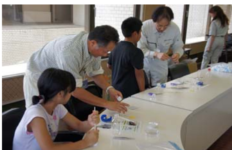
ペットボトル顕微鏡の製作