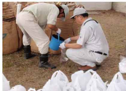
コンポストの配布