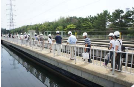
水処理施設の見学