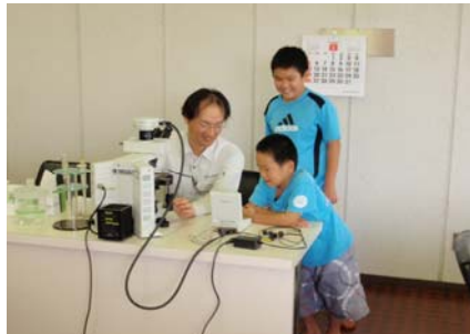
電子顕微鏡で微生物観察