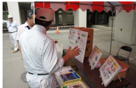
資源循環の仕組みについて