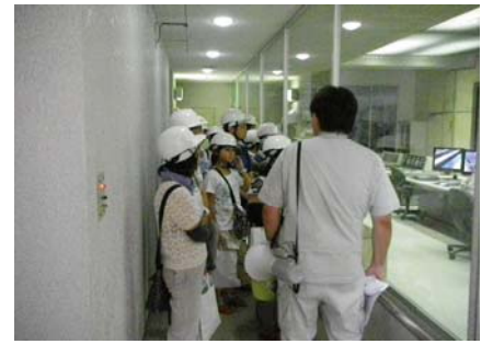
中央監視室の見学