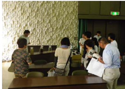
水処理の仕組みについて