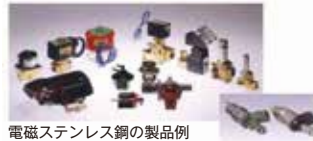
電磁ステンレス鋼の製品例