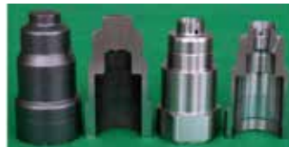
冷鍛、切削加工品の製品例