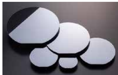
シリコンウエハー