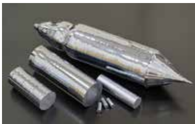
シリコンインゴット