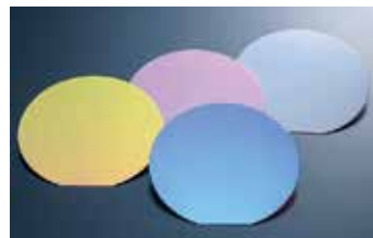
シリコンウエハー(酸化膜付き)