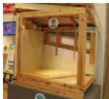
断熱材 サーマックス