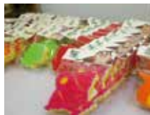
キャラクター スポンジ