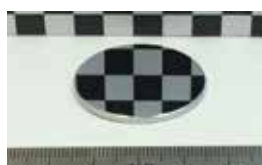
スパッタリングターゲット