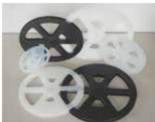
プラスチックリール