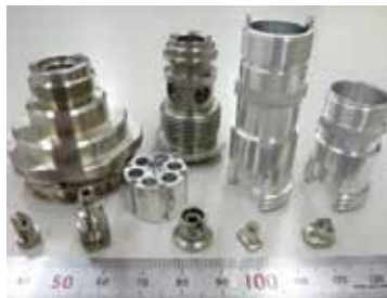
太物加工品サンプル