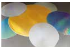
シリコンウェーハ