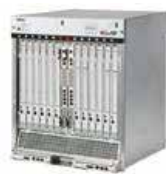
通信ネットワーク制御装置