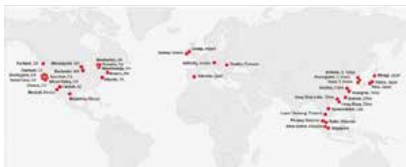
セレスティカグローバルネットワーク

セレスティカは世界第4位のグローバルEMS (電子機器製造受託サービス) 企業であり、国内外の複数の大手電子機器メーカー向けに各種製造受託サービスを提供しております。セレスティカは電子機器製品の生産だけにとどまらず高い信頼性にもとづく製品設計からワールドワイドなサプライチェーンマネジメント、そして製品・システムの修理・アフターマーケットサービスに至るまでエンドツーエンドのものづくりサービスを提供しております。