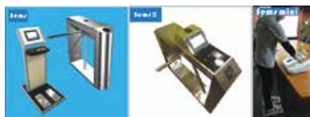
静電気チェック、入室管理システム