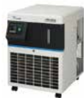
自社製オリジナルチラー