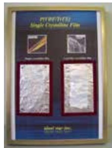
有機圧電デバイス