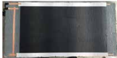
塗布型カーボンナノチューブヒーター