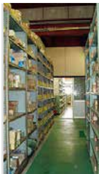
標準ボルト在庫状況