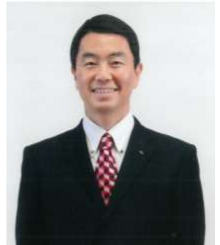
宮城県知事 村井 嘉浩

このような状況を踏まえ、みやぎ高度電子機械人材育成センターでは、産学官の連携の下で、理工系の大学や高等専門学校等の学生を対象とした実践的な研修等を実施して、 意欲あふれる優秀な人材 を養成することを通じ、高度電子機械産業の振興に取り組んで参ります。