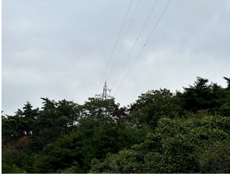
①高圧線下及び近隣区域の現況