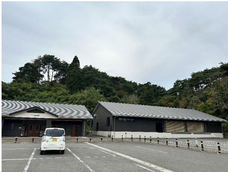
③町営駐車場の状況