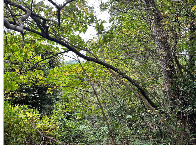
②広葉樹林化が進んだ区域