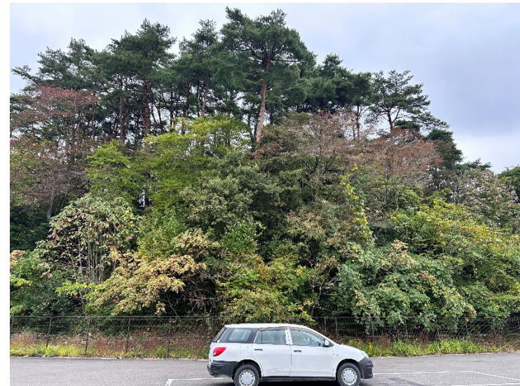
③町営駐車場に隣接する区域