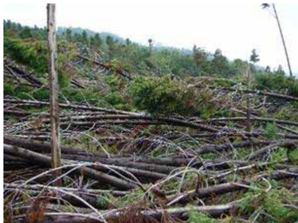
写真17 平成18年10月6~7日の暴風によるスギの倒木