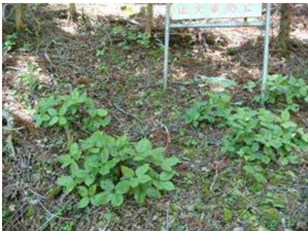
写真18 ヒトリシズカ