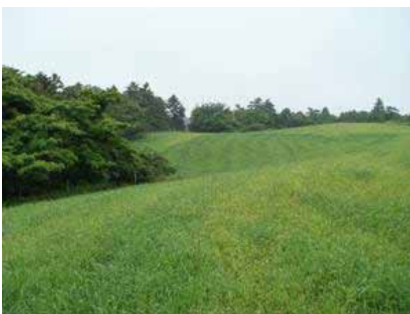
写真6 牧ノ崎にある牧場