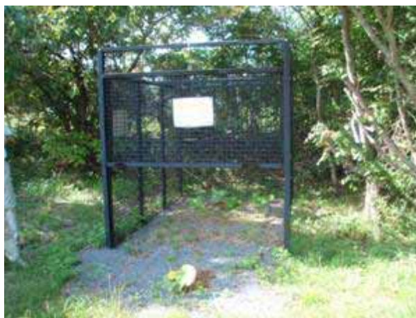
写真 2 5 大型箱わな（針浜）