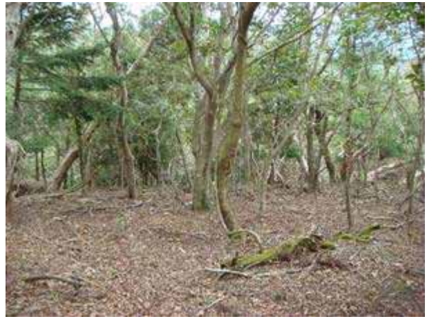
写真11 大六天山の落葉樹林