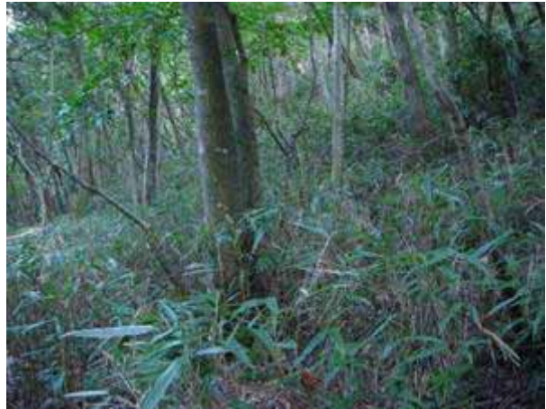
写真15 スズタケ(大石原)