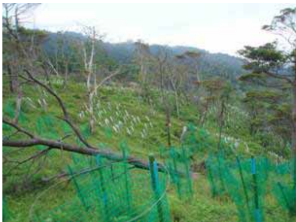
写真 2 2 苗木の防除（黒崎）