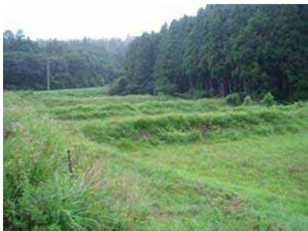
写真 2 0 耕作放棄地（白浜）