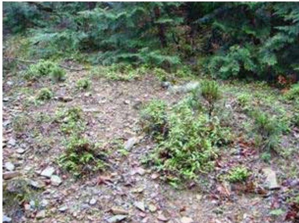
写真8 盆栽状のアカマツとシダ(月浦)