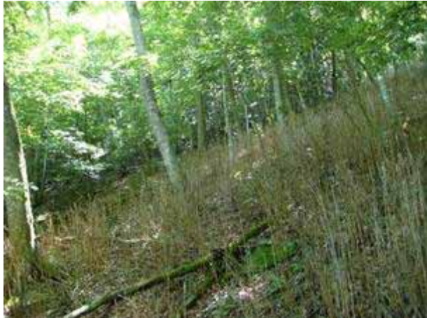
写真16 採食により枯れたスズタケ