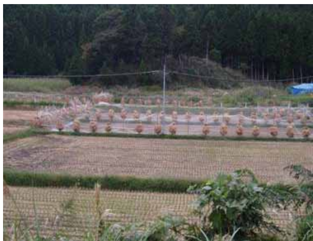
写真 2 4 漁網などを利用した防除網