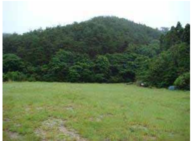
写真3 海岸近くの広い「平地」