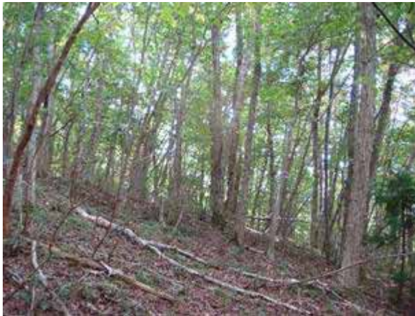
写真10 針浜のコナラ林