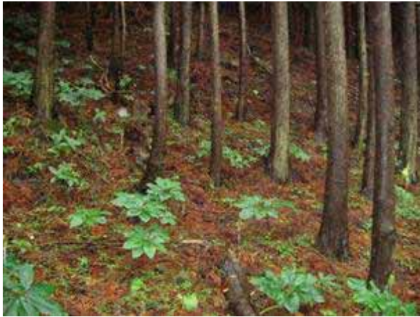
写真14 スギ林内に生育するミミガタテンナンショウ