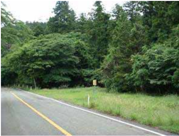
写真2 道路沿いの小規模な「平地」