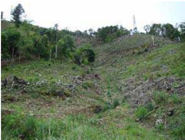
写真4 伐採跡地のベニバナポロギク占有（高白浜）