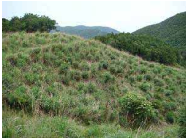
写真5 伐採跡地のススキ群落（小乗浜付近）