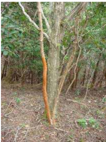
写真12 樹皮を剥ぎされたリョウブ(大六天山)