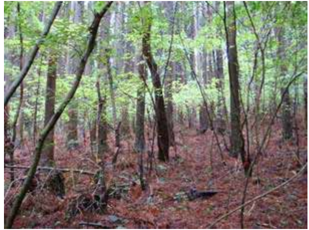
写真9 コナラ林のディア・ライン(黒崎)