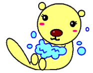
仙南保健所オリジナルキャラクター「てあらっこ」