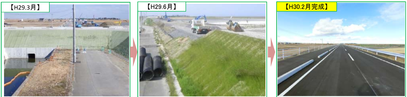
完成済 平成30年2月末に完成しました。