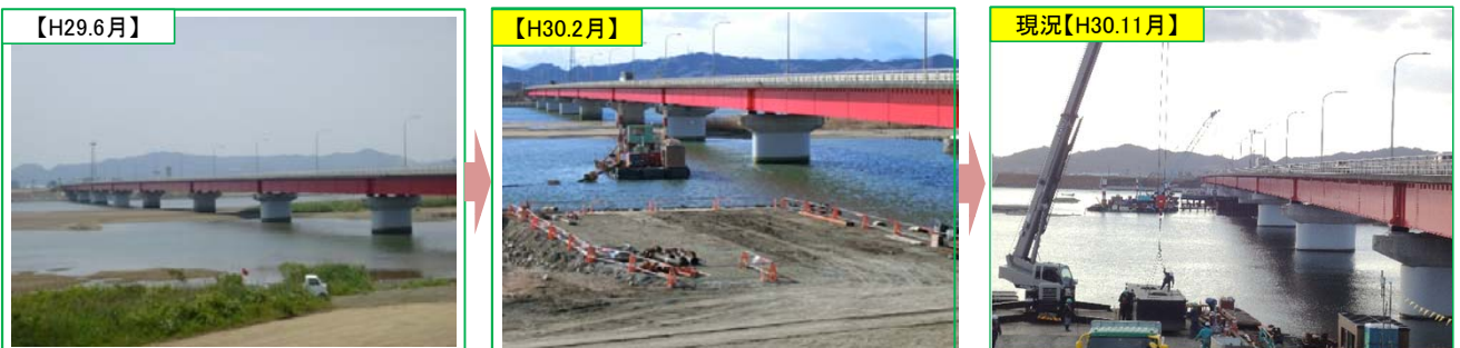
◆今後（来年の夏頃にはこんな感じになる見込みです） 今後、橋脚(2基)の巻立やフーチングの増厚をして、H31年6月の出水期前に完成させる予定です。