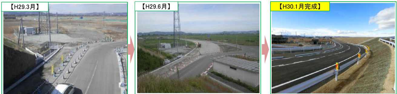
完成済 平成30年1月末に完成しました。