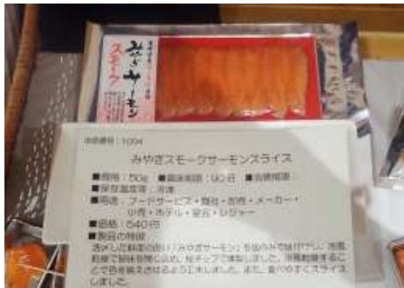
1004 みやぎスモークサーモンスライス 本田水産株式会社