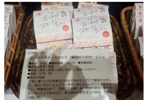
1006 おつまみスモーク明太子 (着色料不使用)20g 湊水産株式会社