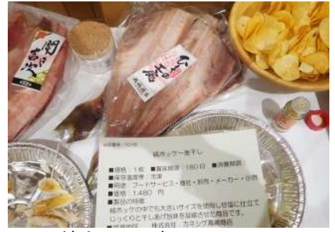
1018 縞ホッケ一夜干し 株式会社カネシゲ高嶋商店