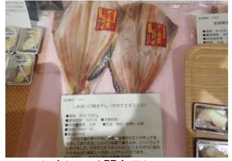
1021 しまほつけ開き干し (ホタテエキス入り) カネヨ山野辺水産株式会社