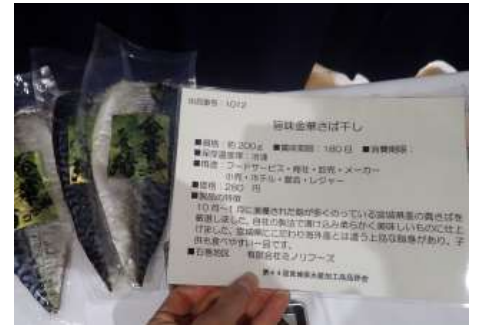
1012 旨味金華さば干し 有限会社ミノリフーズ