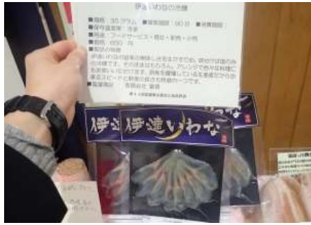
1023 伊達いわなの冷燻 有限会社菅原