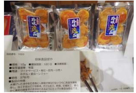
1003 珍味逸品ほや 富士國物産株式会社