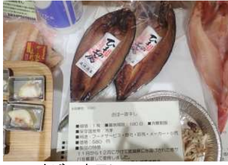
1020 さば一夜干し 株式会社カネシゲ高嶋商店