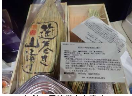
1014 紅鮭一尾筵巻き山漬け 株式会社塩釜水産食品