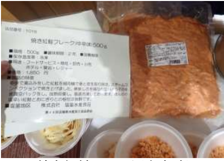
1016 焼き紅鮭フレーク(中辛味)500g 株式会社塩釜水産食品