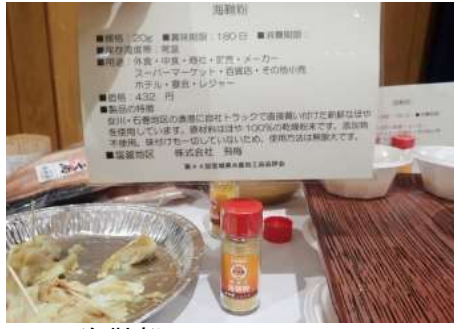
1017 海鞘粉 株式会社飛梅