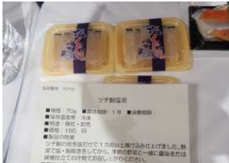
1010 ツチ鯨塩皮 株式会社鮎川捕鯨