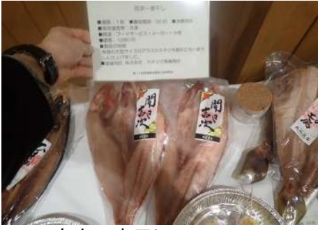
1019 吉次一夜干し 株式会社カネシゲ高嶋商店