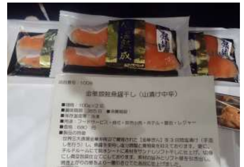
1009 金華銀鮭魚醬干し(山漬け中辛) 株式会社ヤマサコウショウ