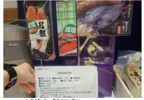
1015 減塩紅鮭切身 株式会社塩釜水産食品