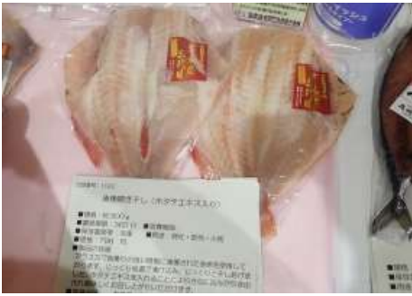
1022 赤魚開き干し (ホタテエキス入り) カネヨ山野辺水産株式会社