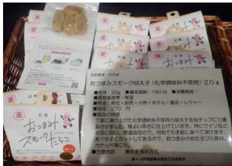
1008 おつまみスモーク明太子 (化学調味料不使用)20g 湊水産株式会社