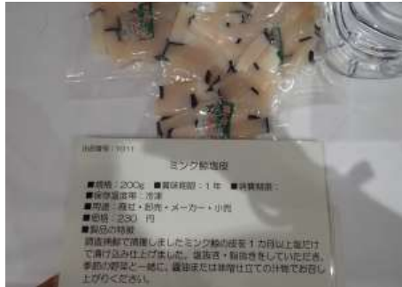
1011 ミンク鯨塩皮 株式会社鮎川捕鯨