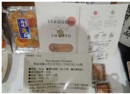
1002 Sea Queen Smoked 気仙沼産メカジキスモーク(炙り生ハム風) 大弘水産株式会社