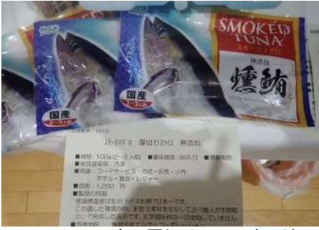
1013 スモークマグロ 厚切りスライス 無添加 株式会社エムケーコーポレーション