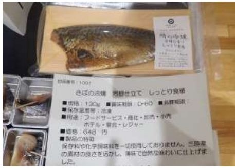
1001 さばの冷燻 芳醇仕立て しっとり食感 株式会社ヤマウチ