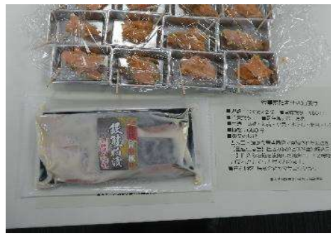
4002 金華銀鮭本仕込粕漬け 株式会社ヤマサコウショウ