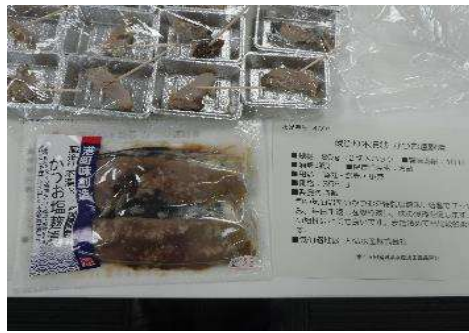
4001 蔵造り本漬® かつお塩麴漬 大弘水産株式会社