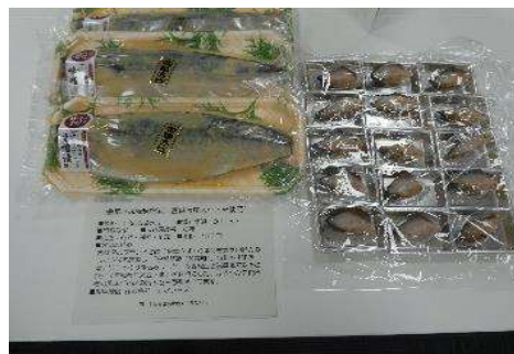
4008 金華さば糍味噌漬(宮城県産大豆・米使用) 株式会社仙水フーズ