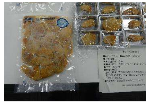
4003 ほやの味噌漬け 株式会社ヤマサコウショウ