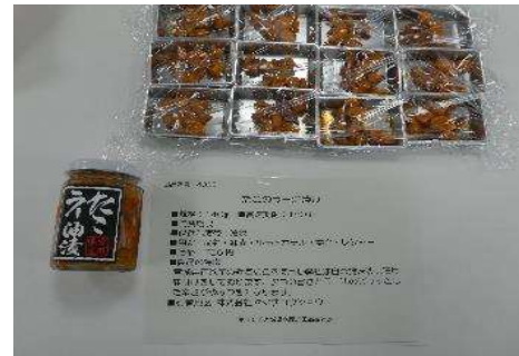
4005 たこのラー油漬け 株式会社ヤマサコウショウ