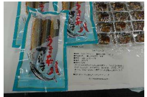
4006 うま辛さんま 株式会社ヤマホンベイツ