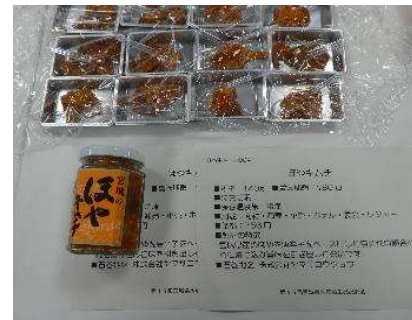
4004 ほやキムチ 株式会社ヤマサコウショウ