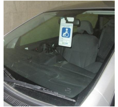
(利用証掲示のイメージ)