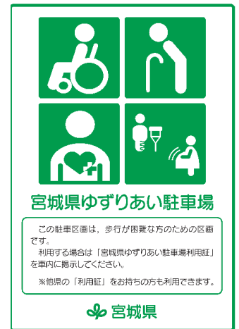
(対象区画であることを示すステッカー)