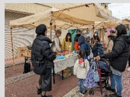
スキルアップ講座 マルシェのボランティア体験