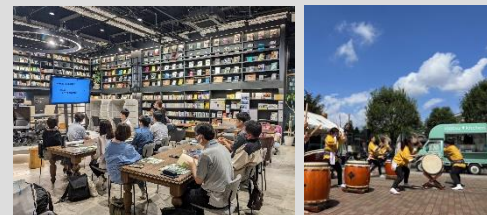
市民大学の“ブレ開校” 河原町マルシェ音市