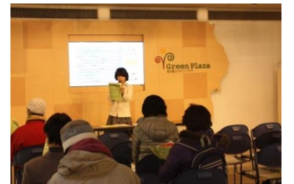
消費生活展での講座の様子

消費生活サポーターになっていただく方には、 認定講座を受講していただきます 。消費生活に関する基礎知識を2日間で学べる内容になっていますので、少しでも消費生活に興味がある方はぜひ受講ください。 受講は無料 です！