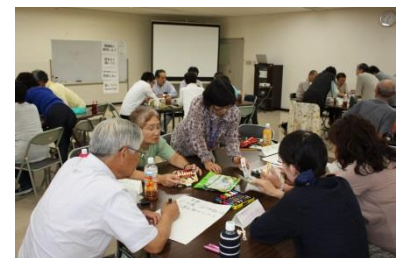
フォローアップ講座の様子

消費生活サポーターになっていただく方には、養成講座を受講していただきます。 消費生活に関する基礎知識を2日間で学べる内容になっていますので、消費生活に興味がある方はぜひお申し込みください。 受講は無料 です！