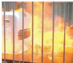
ファンヒーターの前に置いていたスプレー缶が破裂して引火。(再現実験)

石油ファンヒーターの近くに置いていたスプレー缶が加熱されて破裂し、ファンヒーターの火が引火したものです。