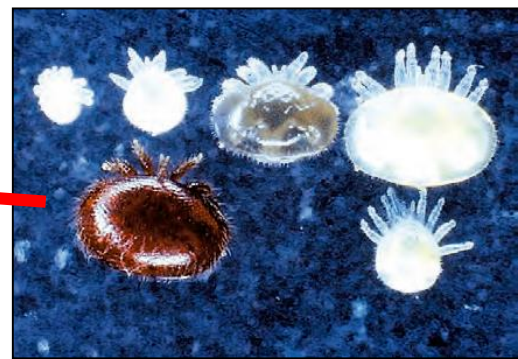
ミツバチヘギイタダニ