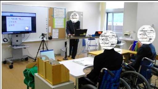
司会担当学級（ホスト側）