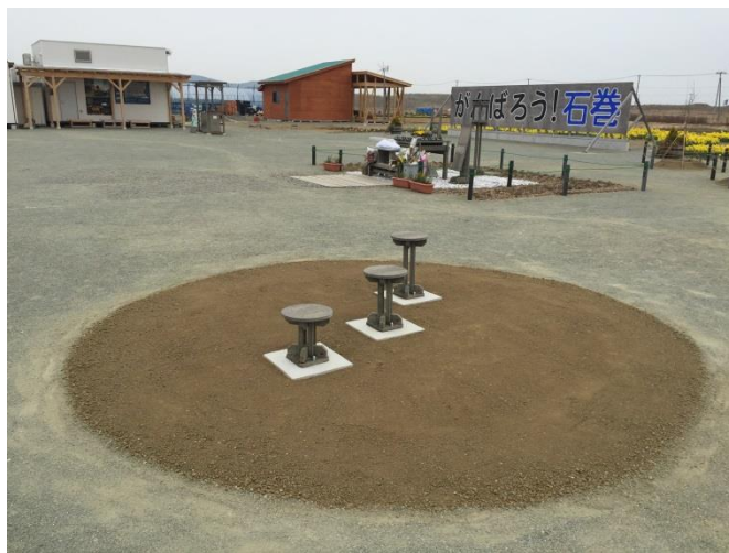
造成完了部から各々の活動を本格化