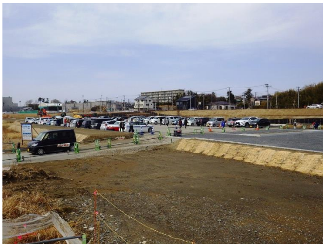
円滑な活動のため整備が進む聖人堀駐車場