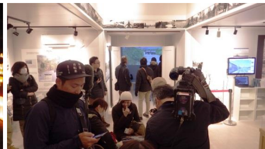
南浜つなぐ館の様子