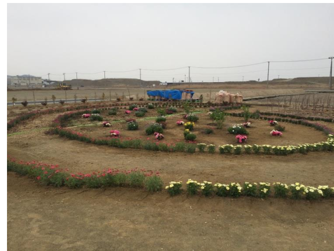
緑化活動団体による花壇整備