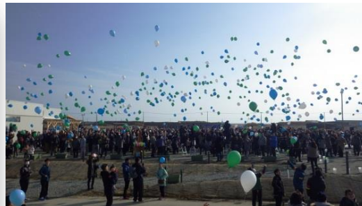
バルーンリリースの様子

この行事は、石巻市地域づくり基金事業助成金・復興庁「心の復興」事業・ソブチミスト日本財団災害復興援助の各助成を受けています。また皆様からの心からの寄付金により運営しています。