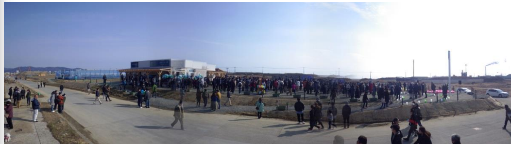
発災時刻の14:46に黙祷が行われた