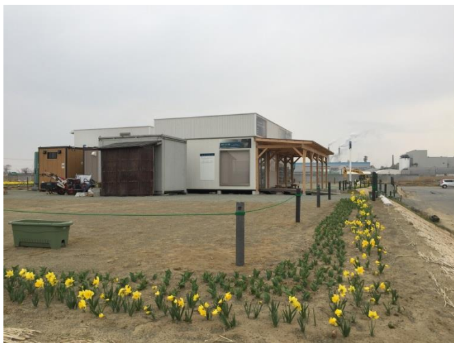
造成地に彩りを添える緑化活動