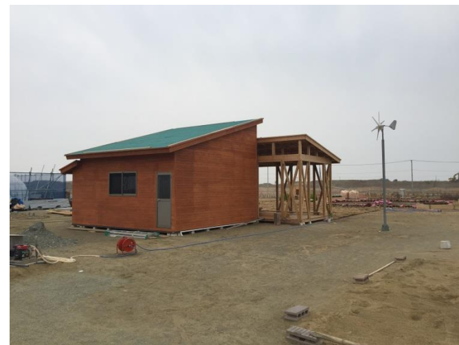
活動団体の交流の場にもなる仮設作業小屋の設置