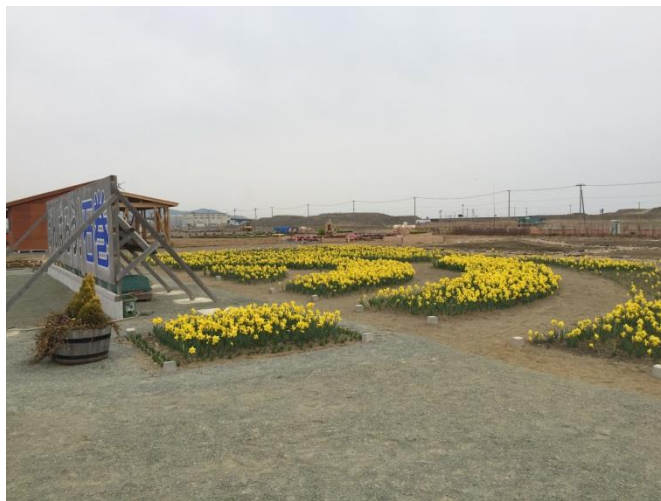
複数の活動団体の連携による空間整備