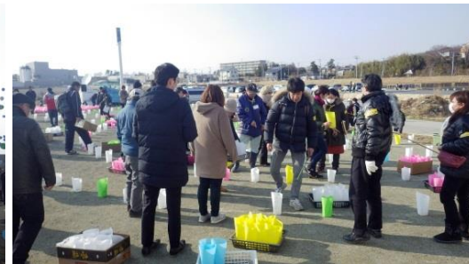
ボランティアと連携した会場設営