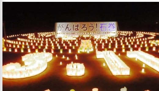
キャンドル点灯時の様子