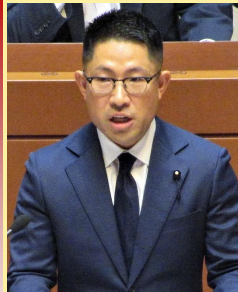
高橋克也議員 (自民)

政策目標では広域防災が一つの目標である。広域防災連携に係る国との協議状況を踏まえ、広域防災拠点のサブ拠点となる防災道の駅が仙台都市圏にないことから、広域防災力の機能確保に向け、仙台東道路の起終点付近に防災道の駅を設置すべきと考えるがどうか。