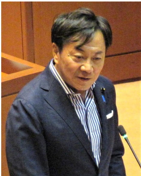
村上智行議員 (自民)