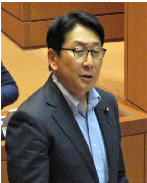
高橋宗也議員 (自民)