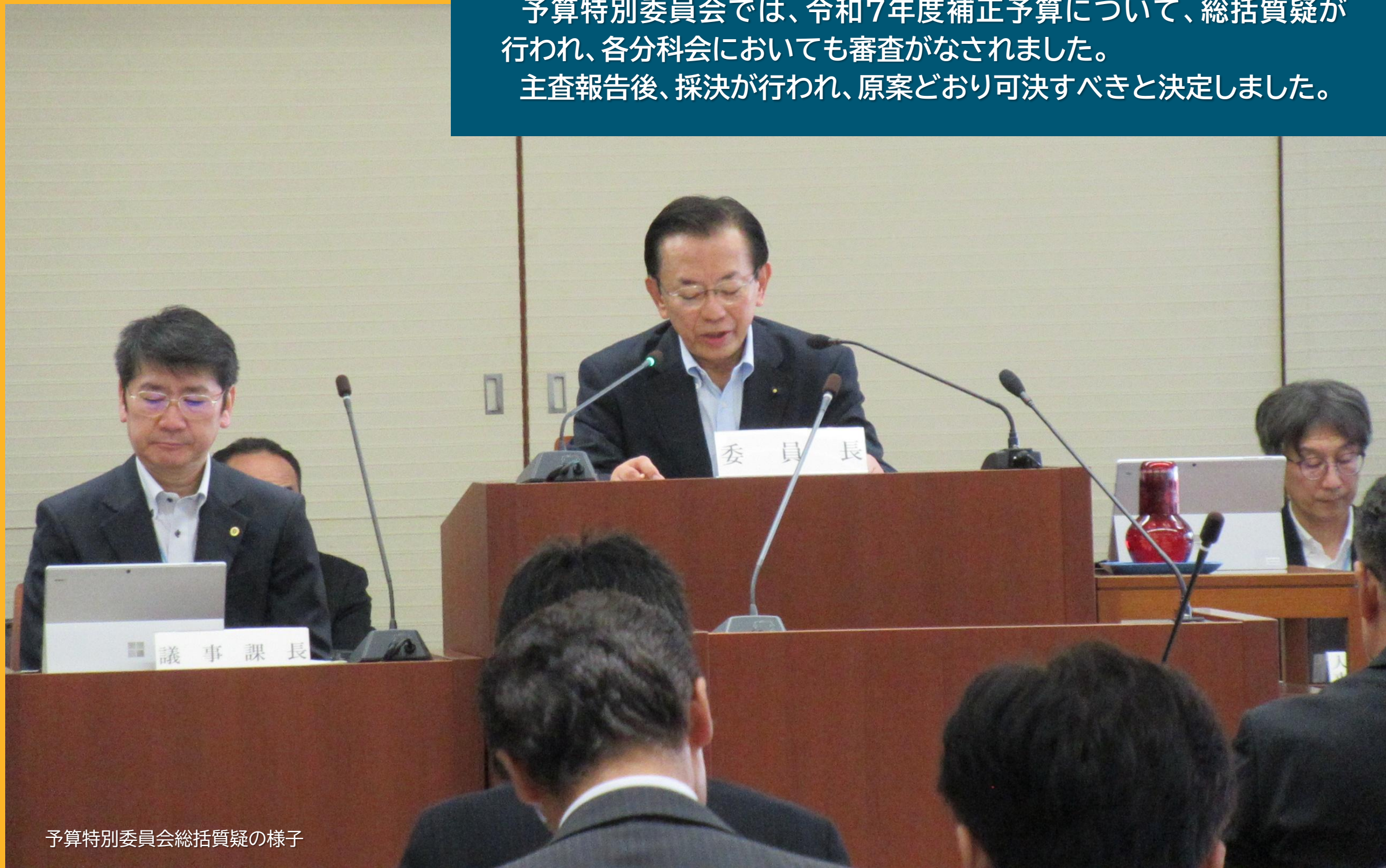
予算特別委員会総括質疑の様子