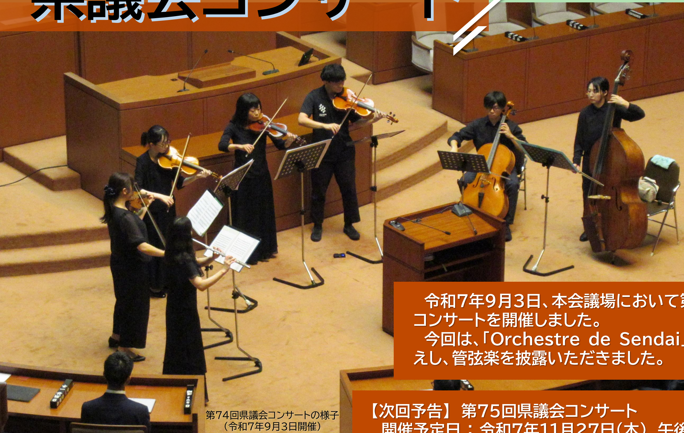
第74回県議会コンサートの様子 (令和7年9月3日開催)