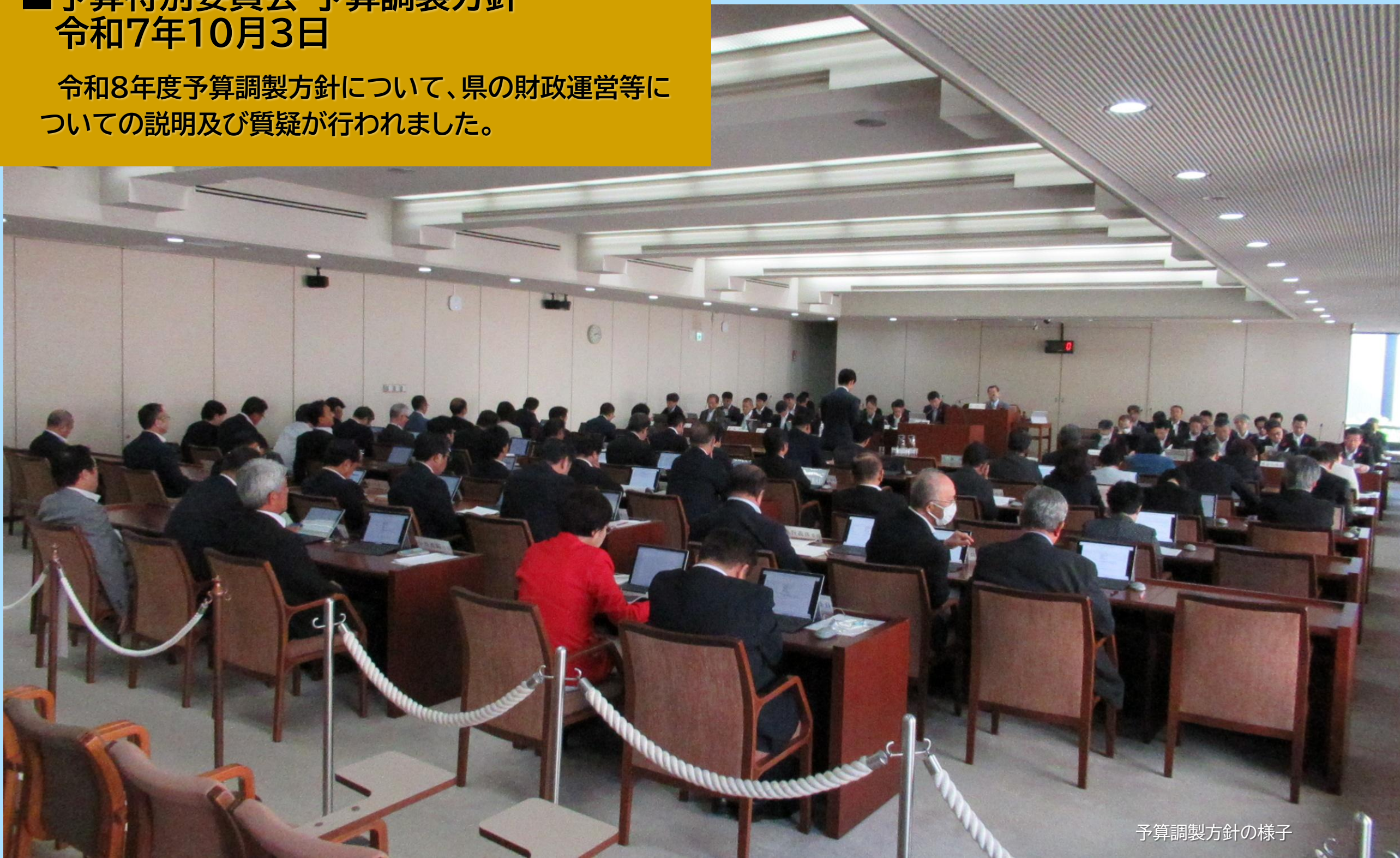
予算調製方針の様子

令和8年度予算調製方針について、県の財政運営等についての説明及び質疑が行われました。