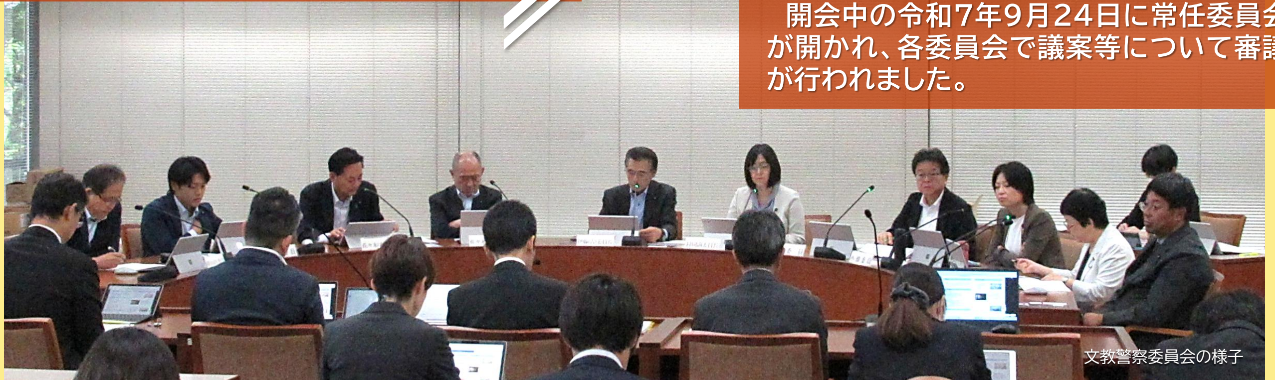
文教警察委員会の様子

開会中の令和7年9月24日に常任委員会が開かれ、各委員会で議案等について審議が行われました。