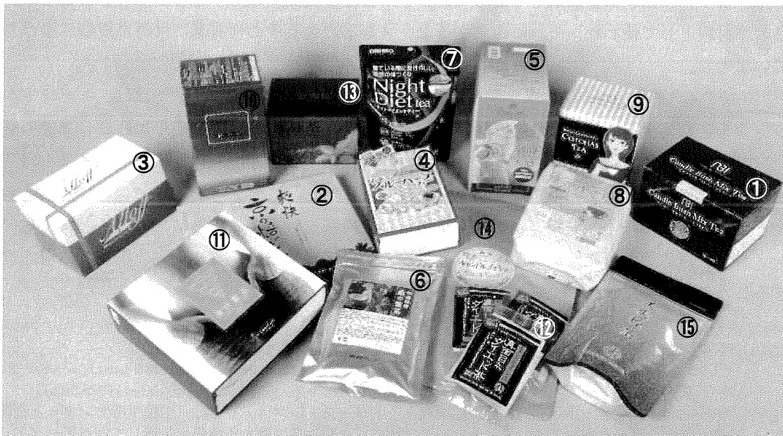
写真2. テスト対象銘柄

インターネットの通信販売及び大手ドラッグストア等で購入可能な銘柄を中心に、「キャンドルブッシュ」「ゴールデンキャンドル」「ハネセンナ」「カッシア・アラタ」が原材料一覧の上位に記載されているティーバッグタイプの健康茶15銘柄をテスト対象としました(写真2、表1)。