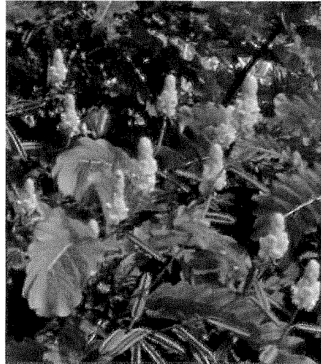
写真1. キャンドルブッシュ

センナの同属植物であり、小葉・葉軸・茎・花などにも、センノシドが含有されていることが報告されています。