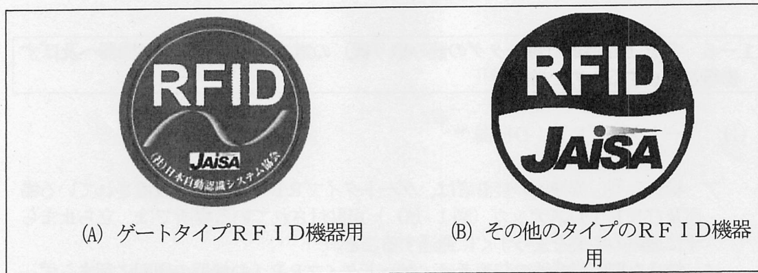
(A) ゲートタイプRFID機器用