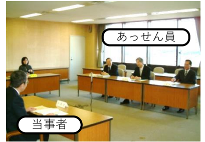
あっせんのイメージ

の三者で構成される「あっせん員」が、当事者双方から丁寧に主張等を聴き取り、労働者、使用者のどちらも納得できる解決を目指します。